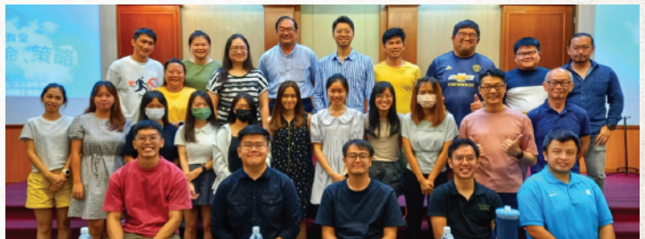
青年部举办【教会青年人流失的探讨和对策2】。共有49位参与者（实体29位、外玻zoom 10位、YouTube10位）。本次交流会是由各堂青年职员、组长、导师同工们给予相关课题的回馈。此交流会乃是为了制造一个可以与青年领袖对话的平台，让青年人可以自由地发表和客观的探讨，回应一切与青年人灵命、做主门徒及使时下趋势的课题。