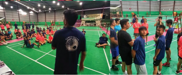
青年部于4月30至5月1日举办羽球家庭赛，成功地吸引了60多位参赛者的参与，圆满进行。