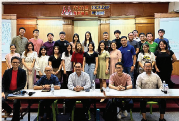
青年部举办的【教会青年人流失的探讨和对策1】共有32位参与实体交流，线上则有10位。

1 2023年5月28日 · 地点：珠巴堂会 2 2023年6月25日 · 地点：珠巴堂会