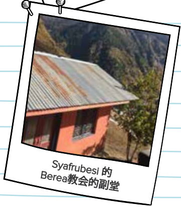
Syafrubesi 的 Berea教会的副堂

即使须经历弯曲凹凸的路程,得以有幸来此见证神在其中的美好作为,值得!求神继续坚固这个小小的教会,藉着教会的长老和众弟兄姐妹在这个山谷中,报佳音、传平安、报好信、传救恩,热忱地向当地的村民传扬说:“主耶和华是应当被称颂的”。奉主耶稣基督的名求,阿们! 🇳🇵