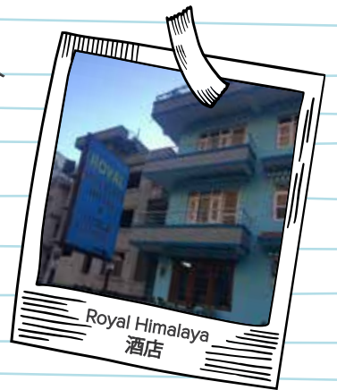
Royal Himalaya 酒店

这是一段让我毕生难忘的路程!从加德满都城市来到这座小镇,须历经六个小时颠簸弯曲和凹凸不平的道路。高原上的奔波劳顿,造成短宣队员们出现各样的不适症状:有人呕吐、有人全身无力、头昏或头重脚轻的感觉。感谢主,我们最终于夜晚10点钟抵达 Syafrubesi,入住 Royal Himalaya 酒店。诗人说:我要向山举目。我的帮助从何而来?我的帮助从造天地的耶和华而来。(诗篇121:1-2)我的心默默地问:是谁帮助我们完成这吃苦冒险的第一段路程呢?是创造天地的耶和华神帮助我们走过!