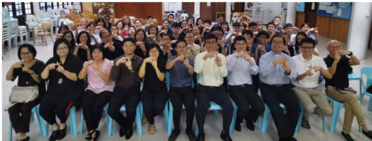
出席者与短宣生合照

除了日常上课，短宣生也有实践的课程，如：出外布道传福音、医院探访、跟随牧者教会探访，也有在丧礼时帮忙。此外，短宣生也学习一些生活技能，比如煮饭烧菜，大家轮流做，那也是一段紧张又开心的时间。