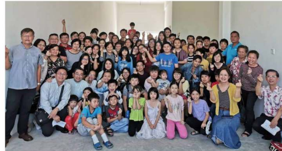
14/7/2019年新堂装修前祷告聚会

愿古晋福音堂荣耀天父，成为福音的出口，使多人、多族和多国，因你们得着永恒的盼望和真正的平安。