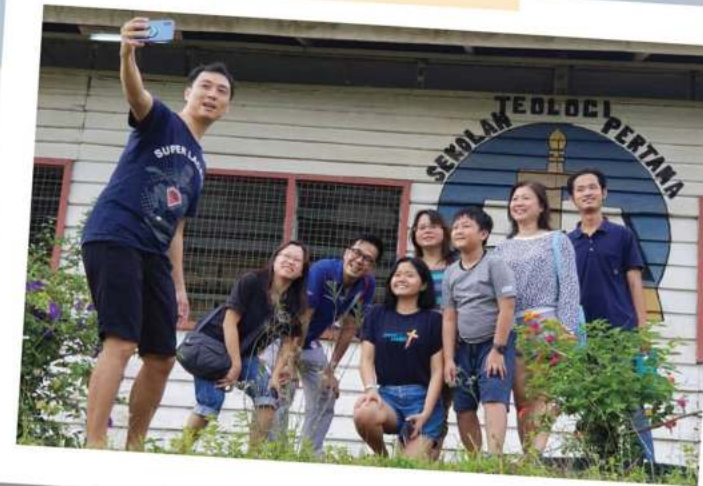
西马宣教队探访Lg Lama神学院

弟兄姐妹，我们非常需要你们的参与、关心和祷告。当你想到在前线的宣教士，或者全职服侍的人，请停下脚步为他们提名祷告。我们所面对的不是一般的想象那么简单。因为我们所面对的不是与属血气的争战，乃是与那些执政的、掌权的、管辖这幽暗世界的，以及天空属灵气的恶魔争战。(弗6:12)