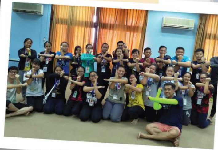
24位学生奉献自己成为主使用的人