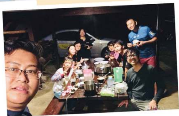
同路人安息退修会