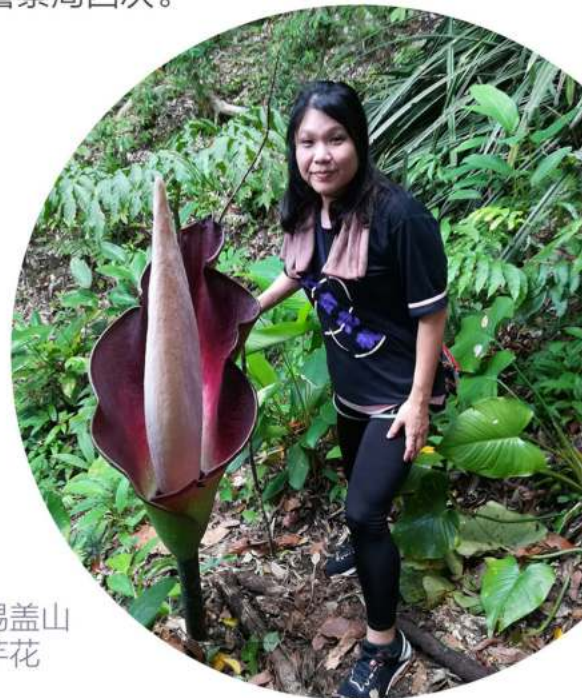
古晋锡盖山的魔芋花

初来乍到的菜鸟很快又面对 第二个文化冲击 。当我问弟姐妹某某地方在哪里时，他们会以三哩、七哩、两哩半来形容，听完之后我还是不知道那里在哪里。但是很奇怪，渐渐的自己也成了这样指路的人。初到古晋时时常迷路，尤其是晚上，古晋对我而言是一个特别多交通圈的城市。有一次晚上从外面办完事要回牧师楼，经过一个又一个的交通圈，每一个出口感觉都是回家的路，但奇怪怎么越走越陌生。还有一次，实在不知道自己转到哪里去了，进了一个看起来是马来人居住的 Kampung ，吓坏了告诉自己冷静，妳怎样进来就怎样出去，转了好久还是没找到正确的路，唯有把车子停靠路边，打开手机的定位导航，细心听着从手机播出来的声音 Turn Left, Turn Right ，终于平安到家，我对手机导航里的声音说谢谢妳。在古晋的五年半经历了牧师楼进贼一次、车牌被偷一次、车子失控车祸一次、教会电缆被偷、去了警察局四次。