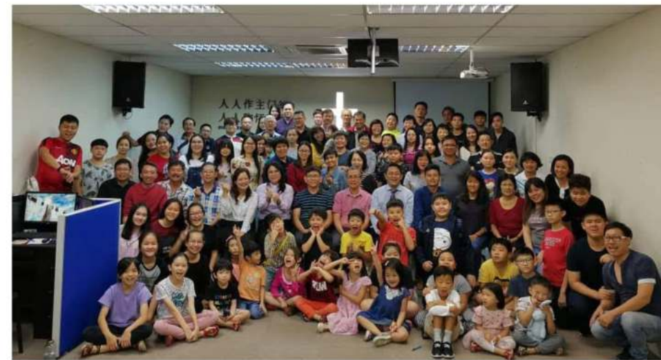
17/11/2019年在旧堂最后一个主日崇拜留影