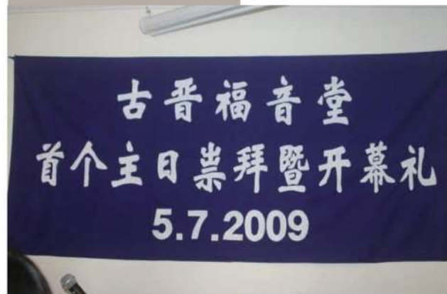
古晋福音堂 首个崇拜暨开幕礼