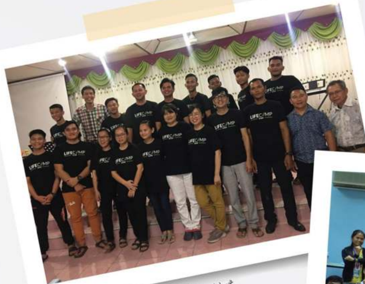
带12位马鲁帝学生进到另外村庄