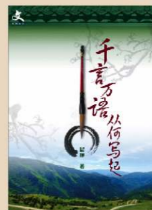
书名：《千言万语 从何写起》 作者：晨砚 出版社：文桥传播中心有限公司 出版日期：2015年7月初版