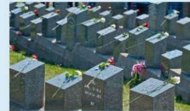
在哈利法克斯 (Halifax) 的 Fairview Lawn Cemetery 里，安葬着121名铁达尼号的遇难者。

今天，我们是否愿意将自己的时间、金钱、爱分享给有需要的人？尤其是我们亲爱的家人——我们的父母、爱人和孩子。盼望趁著今年的圣诞节，我们把爱分给别人，这是送给耶稣最好的礼物。