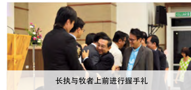
长执与牧者上前进行握手礼

结论：完成主托无愧於心。无愧：不感到羞愧，因为对於主所托付的责任完成了！主的托付：(1) 大使命 (万民成为门徒)；(2) 大诫命 (爱神爱人)。