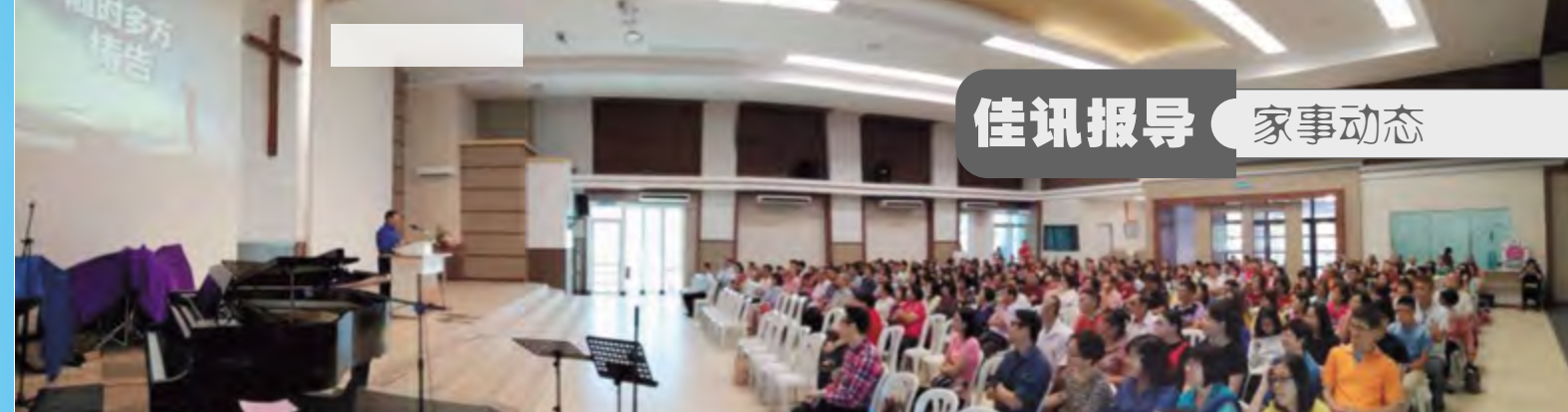
01/01/2018 《随时多方祷告》研讨日

为教会走向《精心门训教会》计划，本会于2018年1月1日假廉律新堂举行《随时多方祷告》研讨日。“靠着圣灵，随时多方祷告祈求；并要在此儆醒不倦，为众圣徒祈求。”（弗六18）。当天主要出席的人是会长执，圣工团委员，团契职员，组长及主日学老师赴会。共有293人出席聚会。