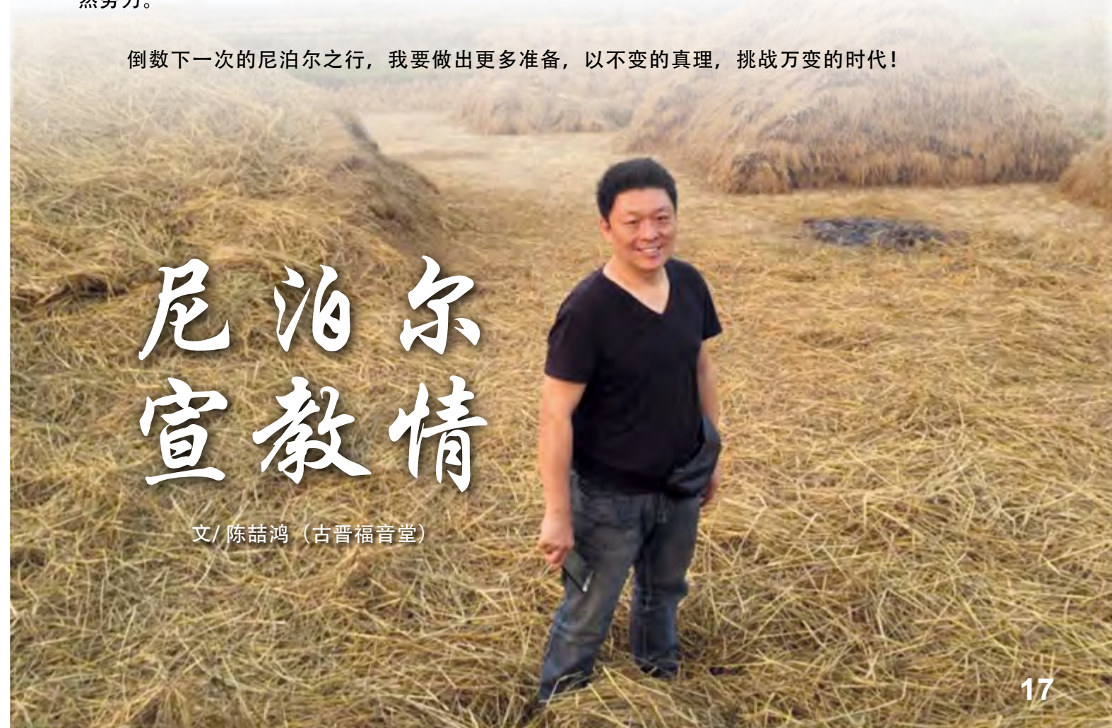
文/陈喆鸿（古晋福音堂）