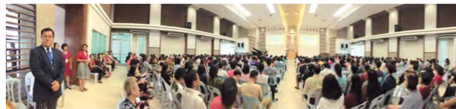
感恩落成崇拜聚会

感谢主，本会廉律新堂已顺利落成，并于三月4日举行感恩落成崇拜。愿一切荣耀颂赞归给成就这一切的主，也感谢许多弟兄姐妹鼎力出钱出力的完成这新堂的工程！愿主报答。