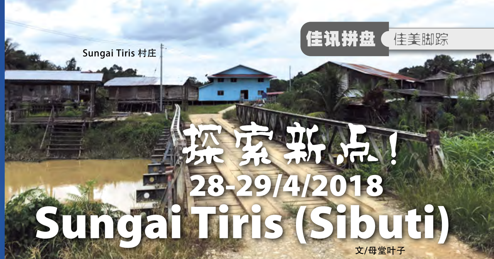
Sungai Tiris 村庄

我被圣灵感动，天使就带我到一座高大的山，将那由神那裡、从天而降的圣城耶路撒冷指示我。城中有神的荣耀；城的光辉如同极贵的宝石，好像碧玉，明如水晶。（启21：10-11）