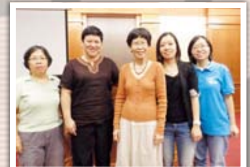
文字部委员与讲员（左起第三）合照

红瓶子、绿瓶子的故事讲到一个绿瓶子嫉妒一个红瓶子，因为红瓶子的身价比较高。原来红瓶子是用煤气窑来制造，而绿瓶子是用电窑来作的。红瓶子的颜色之所以红是因为经过高温和烟的熏染，而绿瓶子不需要经过这一切苦难，所以身价比较低。这故事带出人生里的苦难是有价值的。故事里的陶匠是上帝，祂爱我们每一个人，祂爱红瓶子，也爱绿瓶子。“不爱自己的小圈圈”带出来的含义是要爱我们本来的样子，美容姐妹很幽默的说：蜜蜂是住在组屋，而蜗牛小圈圈是住独立洋房。