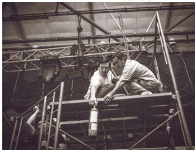
惊险一幕！我们的救火英雄！