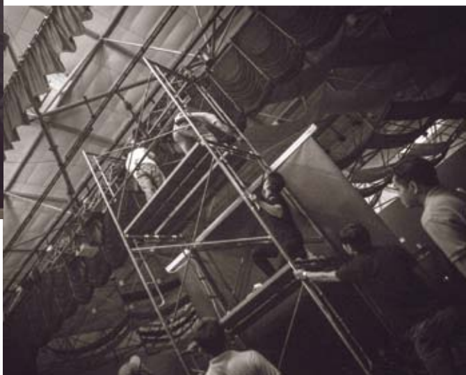
齐心合力去灭火、体现爱主、委身、合一的精神！