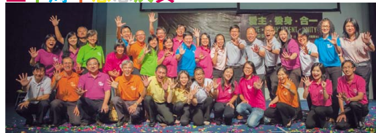
全体牧者和讲员合照