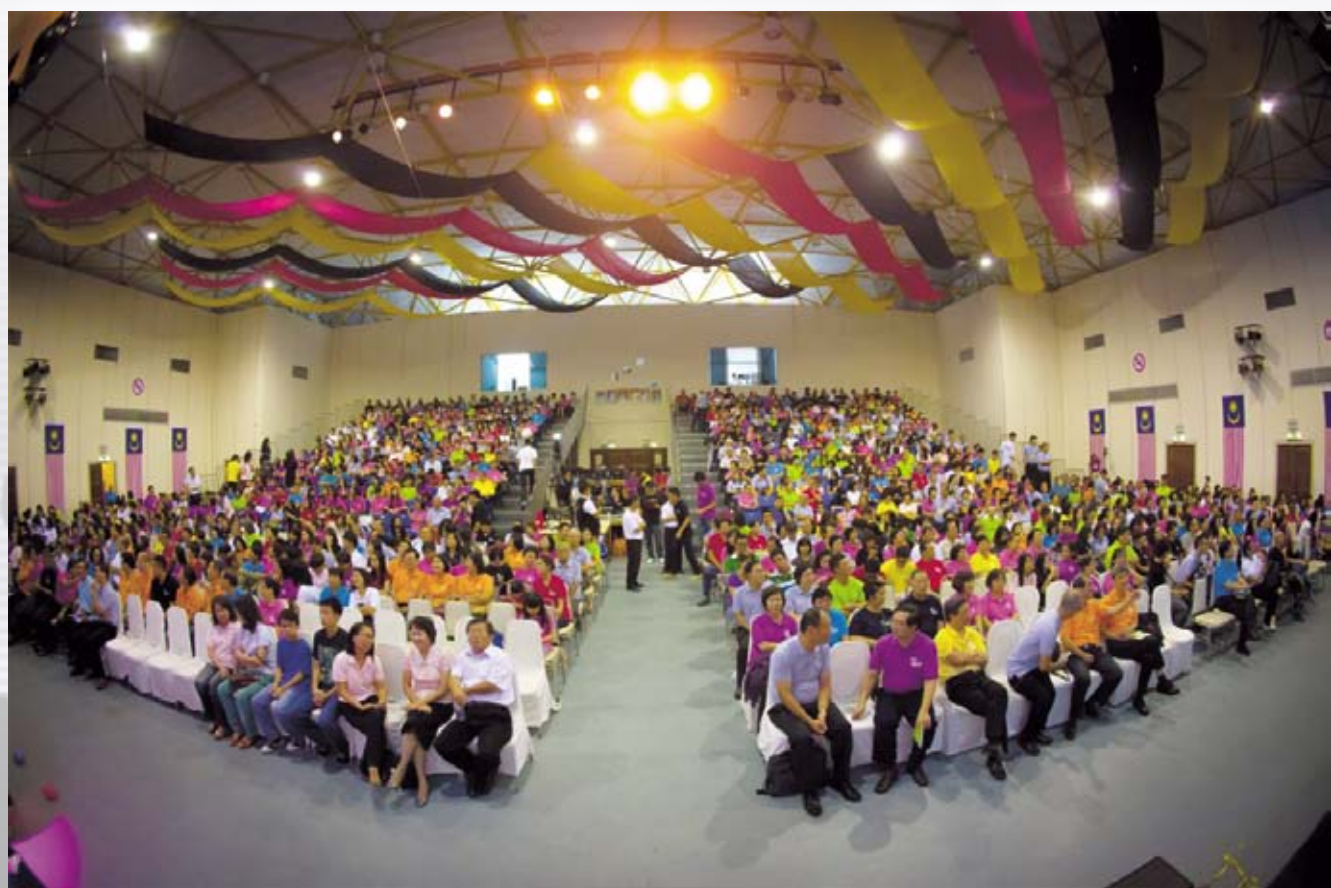
美丽的彩虹，美里福音堂合家

美里福音堂于七月廿一日于民事中心举办五十周年感恩庆典。当晚会场座无虚席，出席者逾千人，大家都怀着喜悦及感恩的心参与。